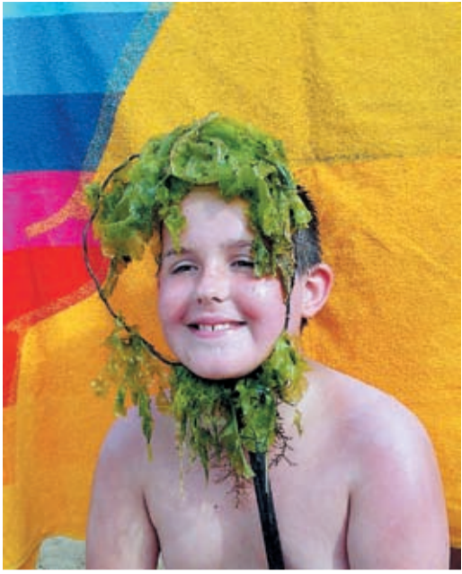
Таким был дядька Черномор в театральном представлении приморских детишек