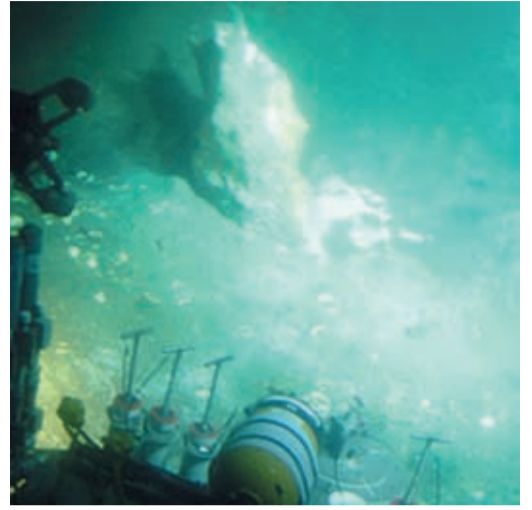
Залежи гидрата метана на морском дне

Ещё один фокус природы, в котором, возможно, «замешан» метан. Известно, что в Бермудском треугольнике бесследно пропадают корабли и самолеты. Одно из научных объяснений – высокое содержание природного газа в морской воде. Дело в том, что при подъёме метана к поверхности вода насыщается пузырьками газа и плотность воды резко падает. Корабль просто тонет. Нечто похожее происходит и в небе. Метан легче воздуха, поэтому он поднимается вверх. Плотность воздуха меняется, а это не может не сказаться на аэродинамике самолетов. Они просто становятся неуправляемыми, а если содержание метана в атмосфере будет достаточно