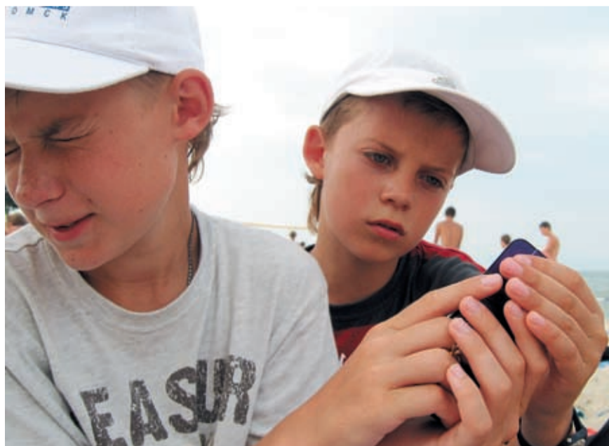
Если раньше друзья вместе читали письма, то в наше время друзья вместе читают СМС-ки