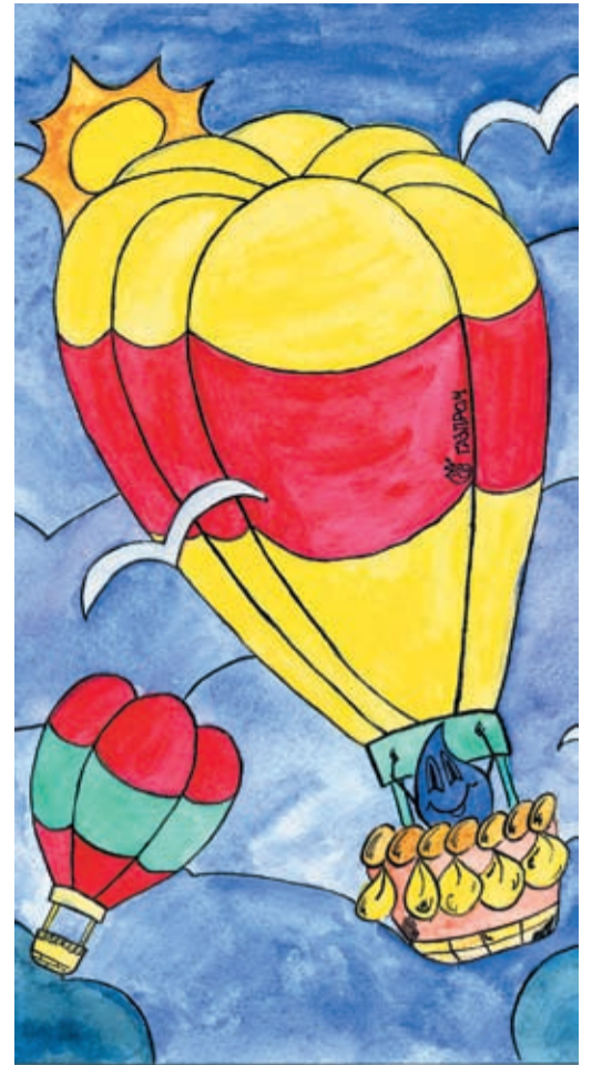
Путешествие Капельки в небо. Рисунок автора, Никиты Иванова

Солнце ласково пригревало облачко, и Капелька сама не заметила, как полетела вниз. Какое счастье парить в воздухе вместе с другими капельками! И вдруг – булк! Она упала в Океан. Дом, милый дом!