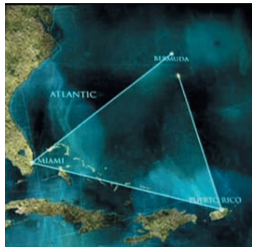
На протяжении столетий Бермудский треугольник наводит страх на мореплавателей

высоким, двигатели могут заглохнуть от нехватки кислорода.