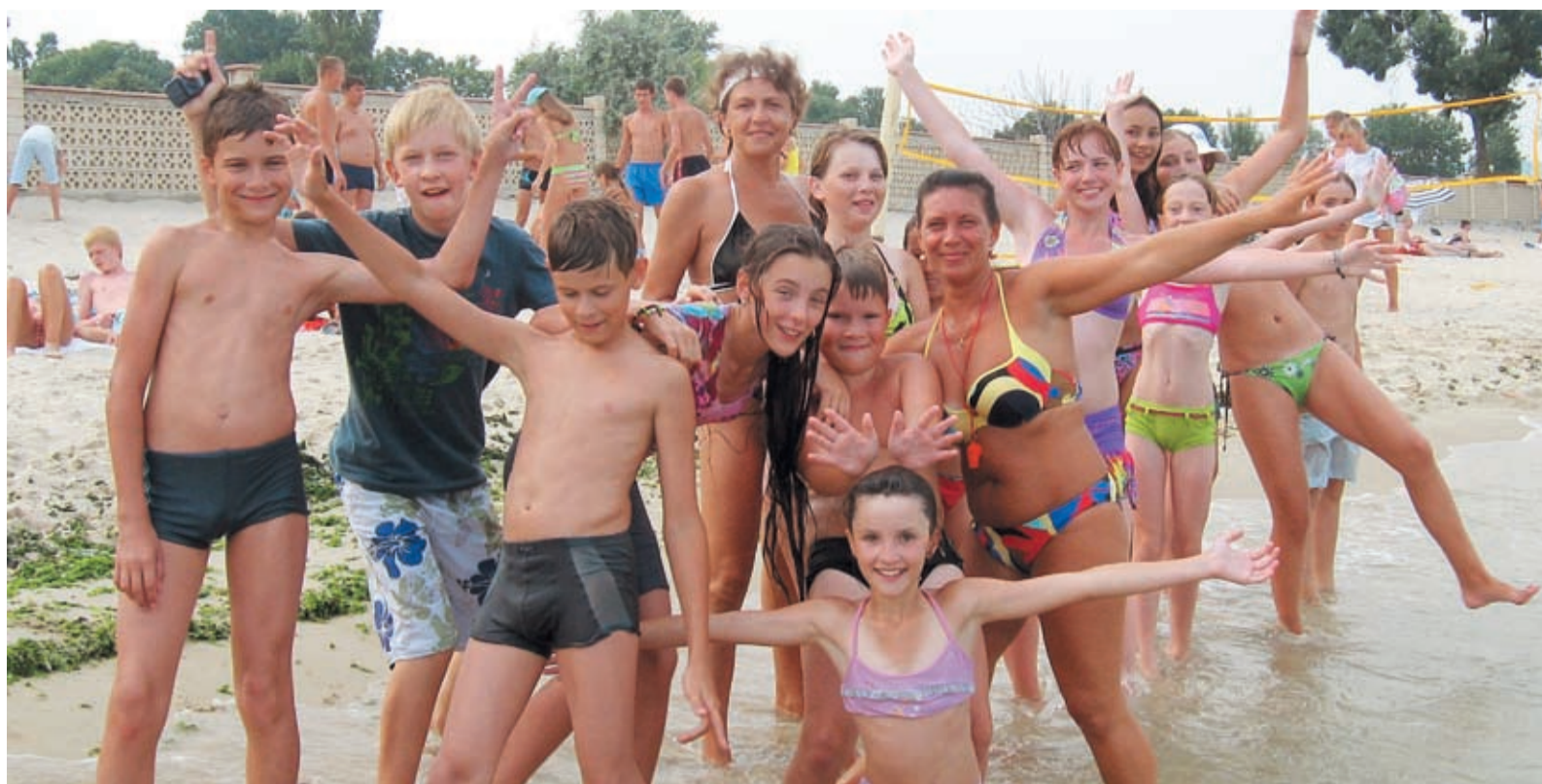
Море даёт такой мощный, потрясающий заряд положительной энергии, которого хватает на несколько долгих зимних месяцев. Одна из смен в Болгарии