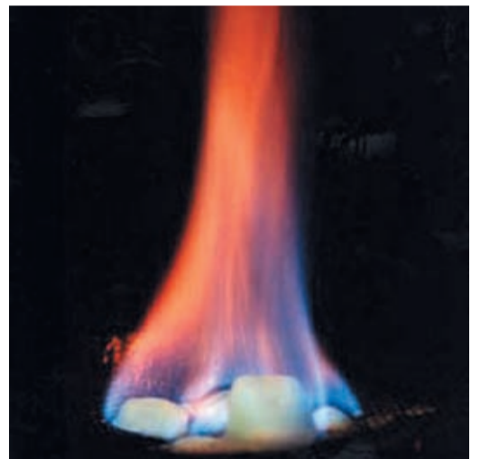
Гидрат метана прекрасно горит