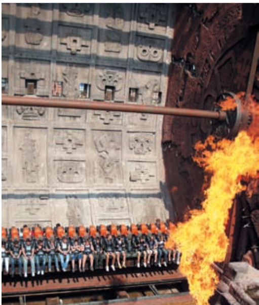
Пожалуй, самыми яркими воспоминаниями детей, отдыхавших в Германии, стали аттракционы в парке отдыха в городе Брюль